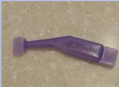
Gotas de sacarosa (azúcar)